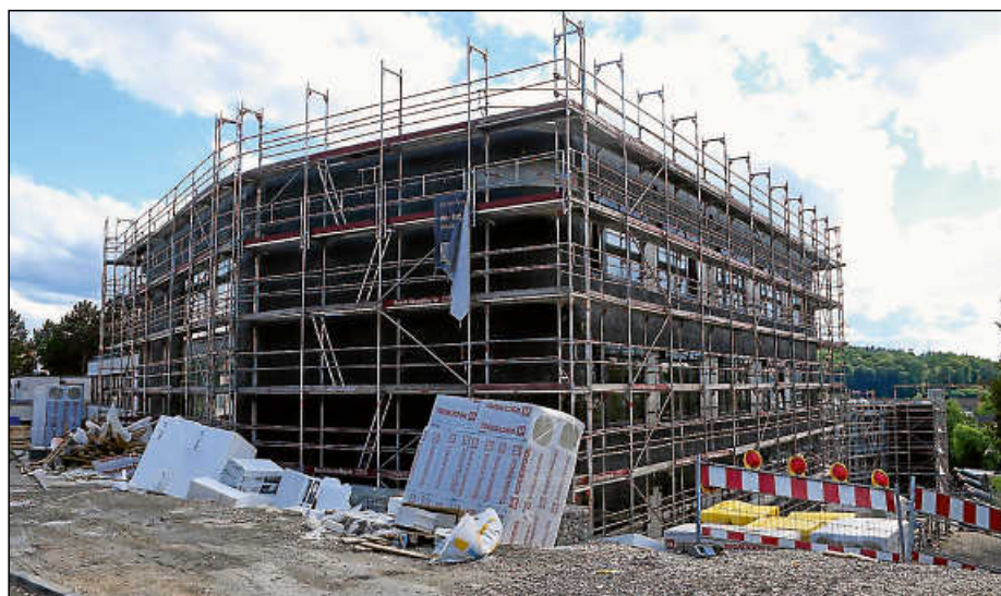
Die Fenster sind nun eingebaut – wegen Verzögerungen verschiebt sich allerdings der Einzug.

Nach monatelangen Verzögerungen hat der Neubau nun endlich Fenster bekommen, trotzdem fehlen die Au-