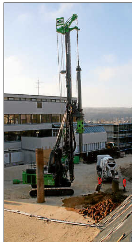
Im Kosten- und Zeitplan: Die Tiefgründungsarbeiten für den Erweiterungsneubau am Gymnasium haben begonnen.