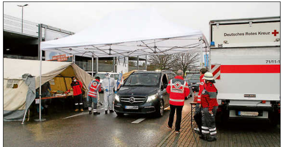
Großer Andrang herrschte beim Corona-Schnelltest-Drive-In auf dem Decathlon-Parkplatz kurz vor den Weihnachtstagen.

Die DRK-Helfer hatten auf dem Parkplatz Zelte aufgebaut, die Freiwillige Feuerwehr Hochdorf stellte ein Notstromaggregat zur Verfügung, die Plochingen Feuerwehr sperrte den Parkplatz mit Bändern ab und