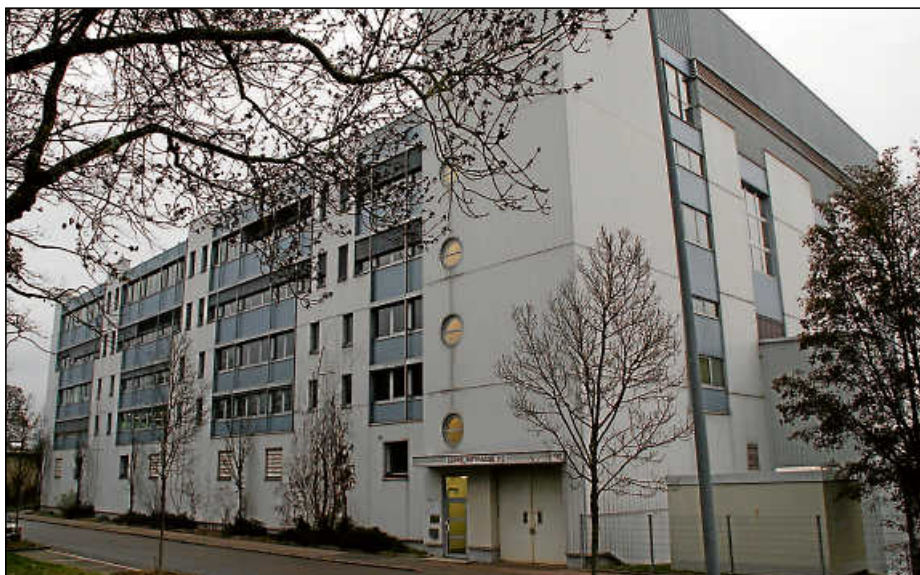
Im ehemaligen Panasonic-Bildröhrenwerk in der Zeppelinstraße 112 in Oberesslingen hat die Kreisverwaltung ein Impfzentrum eingerichtet.

Nach dem Bund-Länder-Beschluss sollen in Landkreisen mit einer 7-Tage-Inzidenz von mehr als 200 weitere lokale Maßnahmen ergriffen werden. So kann der Bewegungsradius auf 15 Kilometer um den eigenen Wohnort beschränkt werden, sofern kein triftiger Grund vorliegt – tagestouristische Ausflüge sind explizit kein triftiger Grund. Wer in einer solchen Corona-Hochburg lebt, darf sich dann nur noch maximal 15 Kilometer von seinem Wohnort entfernen. Will er sich weiterbewegen, braucht er dafür dann einen triftigen Grund, etwa die Fahrt zum Arbeitsplatz. Baden-Württemberg setzt diesen Punkt allerdings nicht um, weil bereits Ausgangsbeschränkungen im Land mit strengeren Regelungen als der Beschluss von Bund und Ländern gelten.