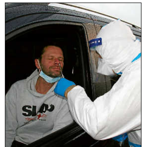
Auch für den Schnelltest war ein Nasen-Rachen-Abstrich nötig.

Teilweise befanden sich in den Autos nur der Fahrer oder die Fahrerin, teils waren auch ganze Familien mit an Bord. Nachdem ein Nasen-Rachen-Abstrich entnommen wurde, parkten die Getesteten ihre Autos neben dem Zelt, um nach etwa 15 Minuten das Ergebnis des Schnelltests zu erfahren.